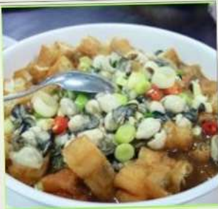
ถนนโบราณซือเฟิ่น