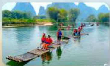
ล่องแพไม้ไผ่หยู่หลง