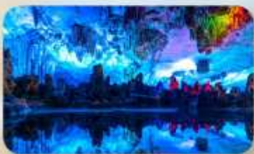
ถ้ำลุย้อ