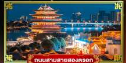
ถนนสามสายสองตรง