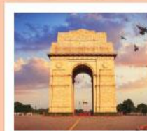
♥♥♥ India Gate