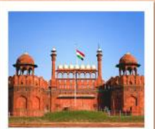
♥♥♥ Agra Fort