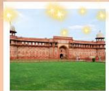
Ajmer Sharif Dargah