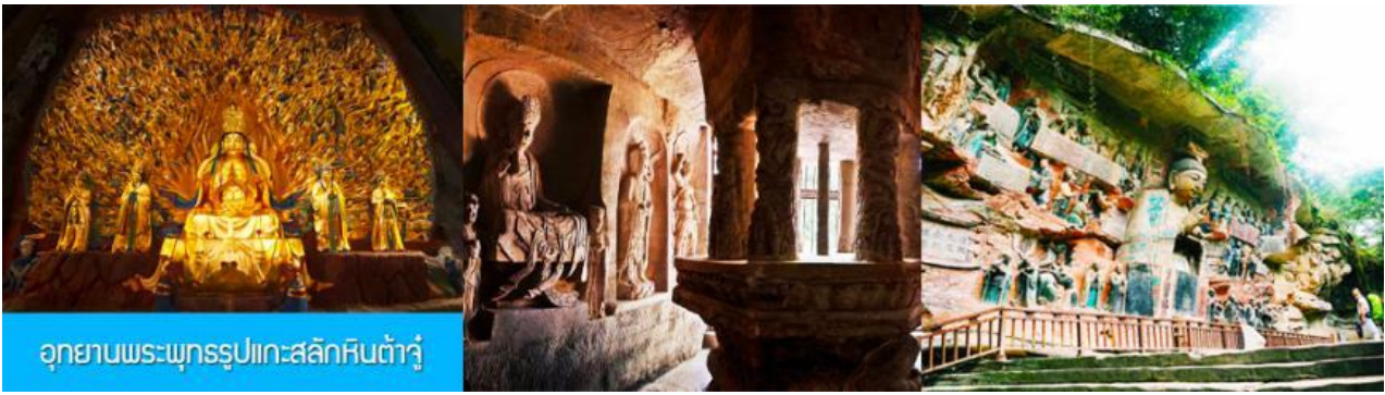
อุทยานพระพุทธรูปแกะสลักหินต้าจู่