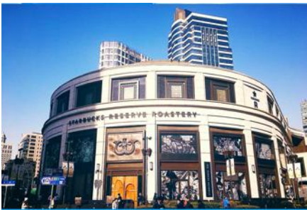
Starbucks Reserve Roastery

รับประทานอาหารกลางวัน ณ ภัตตาคาร *เมนูเดียวหลงเป่า (2)