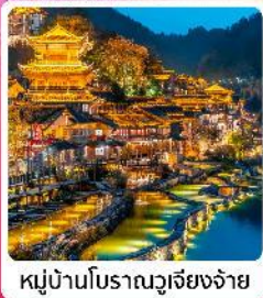
หมู่บ้านโบราณวูเจียงจ้าย