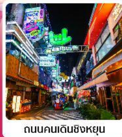
ถนนคนเดินซิงหยุน

• โฮเทล สวนชาคุระผิงปา หนึ่งในสถานที่ชมดอกชาคุระที่ใหญ่ที่สุดในโลก น้ำตกสวยระดับ 5A น้ำตกหวงกั๋วซู หมู่บ้านจีนโบราณ วูเจียงจ้าย