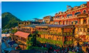
ถนนโบราณจิวเฟิ่น