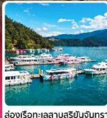
ส่องเรือทะเลสาบสุริยงจินทรา