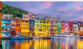
หมู่บ้านชาวประมงหลากสี

*ทางบริษัทฯ ขอสงวนสิทธิ์ในการสลับโปรแกรมทัวร์ตามความเหมาะสมขึ้นอยู่กับสถานการณ์หน้างาน โดยคำนึงถึงผลประโยชน์ของลูกค้าเป็นสำคัญ