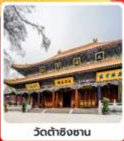
วัดต้าซิงชาน

• โขโลกเที่ยวชมมรดกโลก สุสานกองทัพทหารจีนซีอานจะได้ถ่ายภาพความยิ่งใหญ่ของเจดีย์ห้าชั้นปาใหญ่