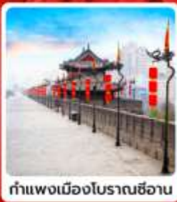
กำแพงเมืองโบราณซีอาน