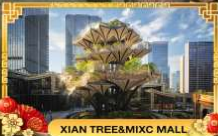
XIAN TREE&MIXC MALL