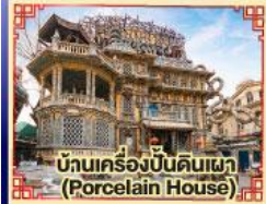
บ้านเครื่องปั้นดินเผา (Porcelain House)