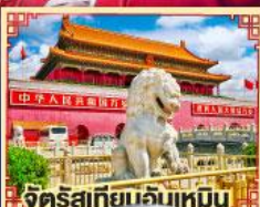
จัตุรัสเทียนจันเหมิน