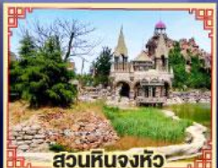
สวนหินจงหัว