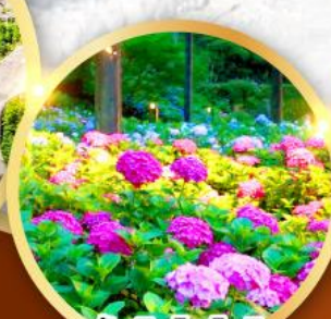
วัดมิมุโระโทจิ