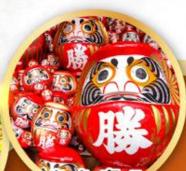
วัดคัตสึโฮจิ (วัดदारุมะ)

ชมความงามของกำแพงหิมะ เส้นทางสายอัลไพน์ทาเคยาม่า (JAPAN ALPS SNOW WALL)