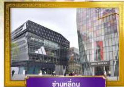
ชานหลี่กู่