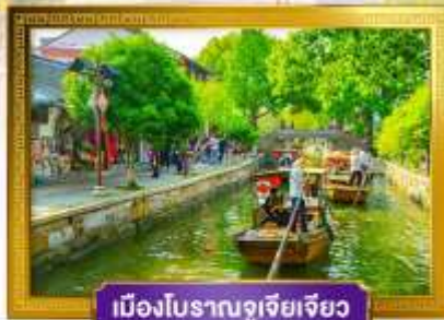
เมืองโบราณซูเจียเจียว