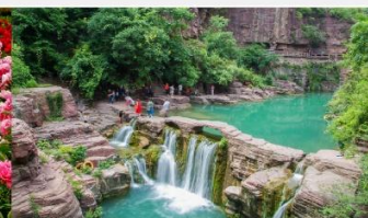
อุทยานหยุ่นโถซาน

*ทางบริษัทฯ ขอสงวนสิทธิ์ในการสลับโปรแกรมทัวร์ตามความเหมาะสมขึ้นอยู่กับสถานการณ์หน้างาน โดยคำนึงถึงผลประโยชน์ของลูกค้าเป็นสำคัญ