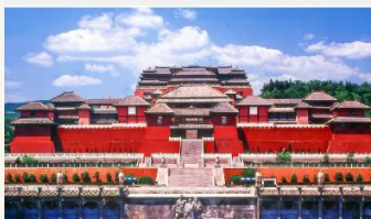
เมืองถ่ายภาพยนตร์