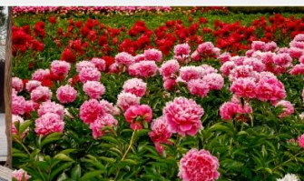
สวนดอกโบตั๋น