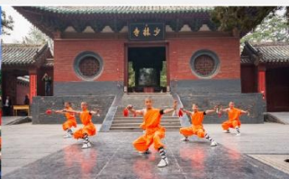
โชว์แสดงกังฟู