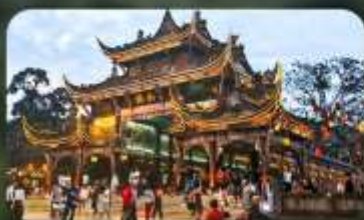
เมืองโบราณกวนเสี้ยน