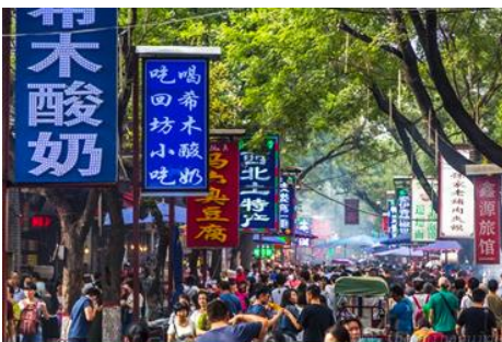
ตลาดมุสลิม