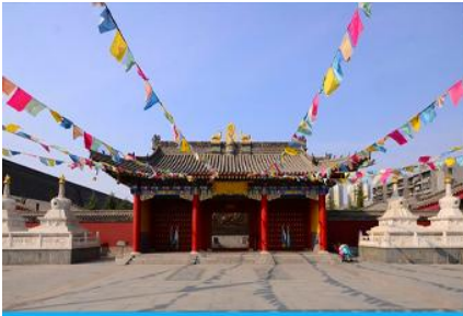
วัดลามะกว้างเหริน