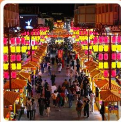
ตลาดกลางคีนซาโจว