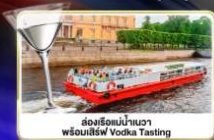
ล่องเรือแม่น้ำแคว พร้อมเสิร์ฟ Vodka Tasting