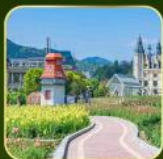
สวน Alice's Garden