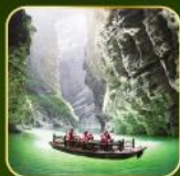
ล่องเรือแม่น้ำไตตั้นกู๋อู๋