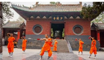
ชมโชว์กังฟูเส้าหลิน

*ทางบริษัทฯ ขอสงวนสิทธิ์ในการสลับโปรแกรมทัวร์ตามความเหมาะสมขึ้นอยู่กับสถานการณ์หน้างาน โดยคำนึงถึงผลประโยชน์ของลูกค้าเป็นสำคัญ