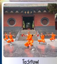
โซ่วกั๋งฟู