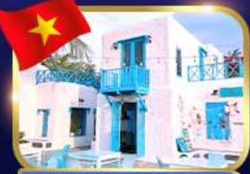
คาเฟ่สไตล์ซานโตรินี่ ชันทรา มาริน่า