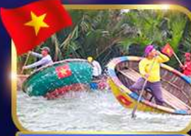
ล่องเรือกระดิว หมู่บ้านกิมทาน