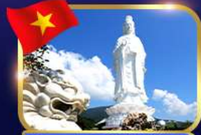
ขอมพรองค์กวนอิม วัดหลินอึ้ง