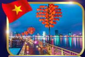
สะพานแห่งความรัก ดานัง