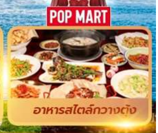
POP MART อาหารสไตล์กวางตุ้ง