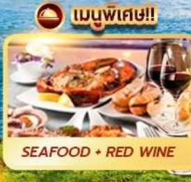
เมนูพิเศษ!! SEAFOOD + RED WINE