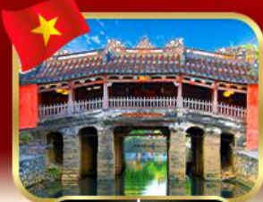
สะพานญี่ปุ่นโบราณ