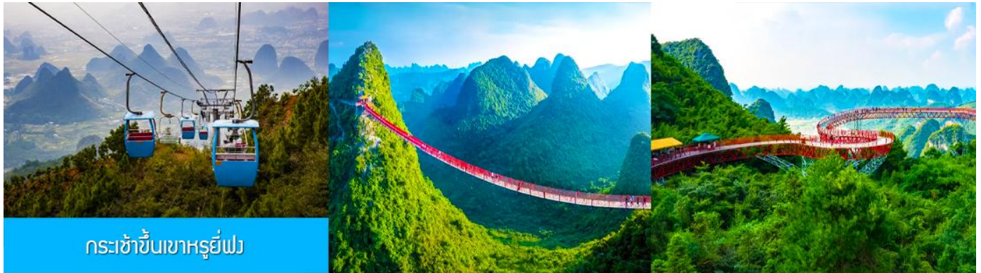
กระเช้าขึ้นเขาหรูยี่ฟง