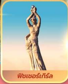
พีชเซอร์เกิร์ล