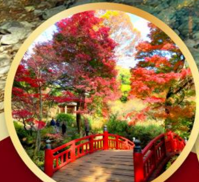
สวนดอกบ๊วยอาคางิ