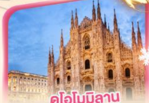
คูโอโมมิลาโน