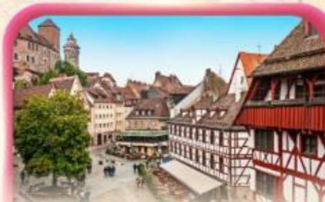
สัมผัสเมืองเก่าบูเรมเบิร์ก