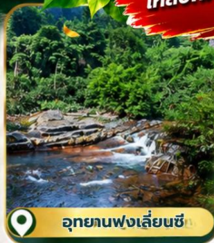
อุทยานฟ่งเลี่ยนซี