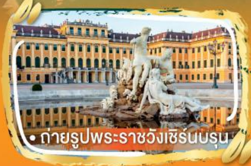
• ถ่ายรูปพระราชวังเชรินบรุน