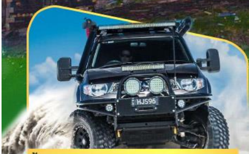
คันรถ 4WD สู้อีจกลางเทือกเขาคอเคซัส