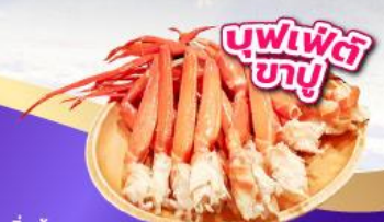
บุฟเฟ่ต์ 3 อย่าง