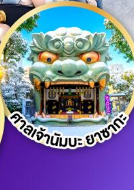
ศาลเจ้ามิมะ ยาชากะ