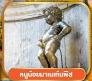
ทูนอยมาบนกันพีส