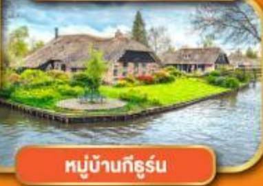
หมู่บ้านก็ธูร์น