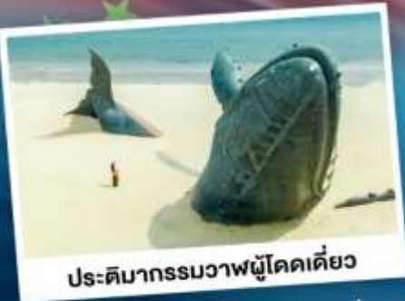
ประติมากรรมวาฬไคโดเคียว

เที่ยวเมืองชายทะเลโอปิตีดี ซิงเต่า - ต้าเหลียน - ฉะเจียงไถ่