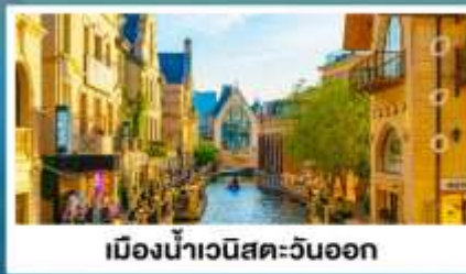
เมืองน้ำเวนิสตะวันออก