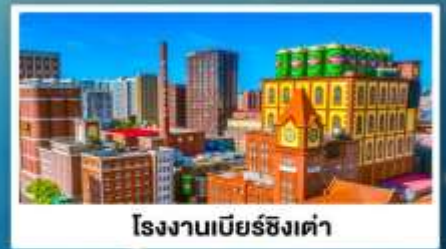
โรงงานเบียร์ซิงเต่า