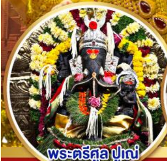
พระศรีศูล ปูणे (Trishul Pune)