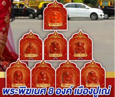
พระพิฆเนศ 8 องค์ เมืองปูणे